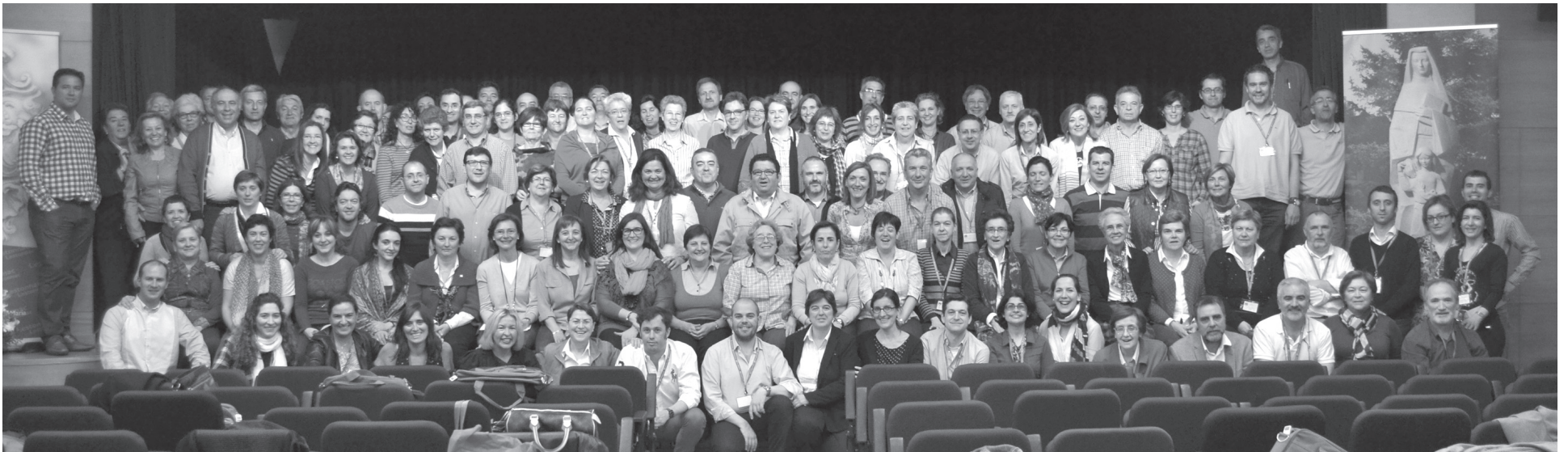
Foto de familia de los equipos directivos Lestonnac.

La Compañía de María está presente en Barcelona desde 1650